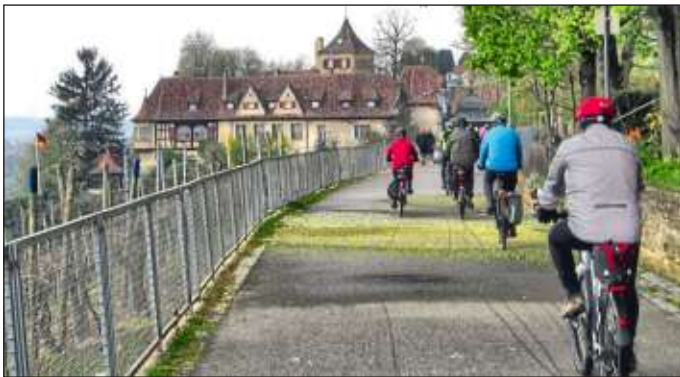
Solche Impressionen wie hier vom Saisonstart im Vorjahr sind momentan noch Zukunftsmusik.

Aufgrund der weiter anhaltenden Beschränkungen bezüglich der Corona-Pandemie muss auch der kommende AOK-Radtreff am 3. Mai abgesagt werden. Die geplante 42 Kilometer lange Tour hätte uns auf kürzestem Wege zum Wunnenstein führen sollen und von dort wären wir ein kleines Stück weit über die Überreste der ehemaligen Autobahn RAB 39 (bzw. alte A81) geradelt. Vielleicht holen wir die Tour im nächsten Jahr nach. Wie es nun weiter geht mit dem Radtreff und ob wir dann 14 Tage später zusammen radeln können, ist noch nicht sicher. Wir werden rechtzeitig informieren. Weitere Informationen gibt es im Internet unter: radtreff.rkvneckarweihingen.de