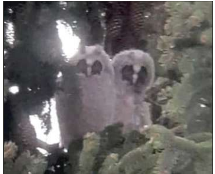
Das Foto zeigt junge Waldohreulen.