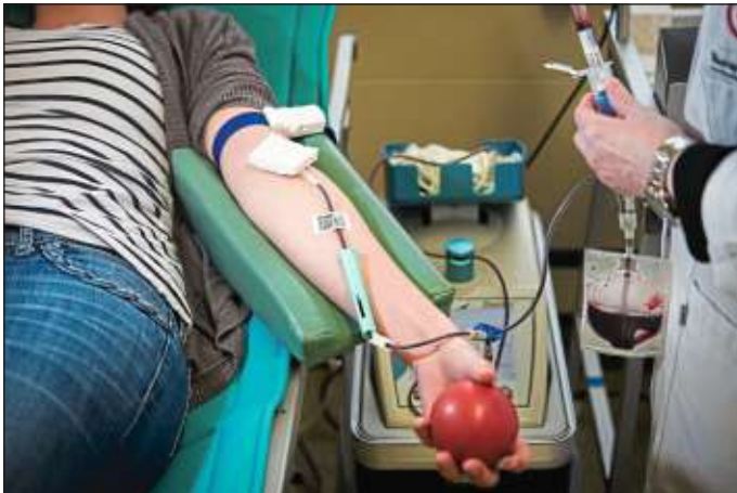
Die Blutspendeaktion in Neckarweihingen ist leider kurzfristig abgesagt worden. Das Deutsche Rote Kreuz bietet diese Aktion aber in Markgröningen an.

Wir bitten um Ihr Verständnis! Bleiben Sie gesund! Ihr DRK Ortsverein Neckarweihingen