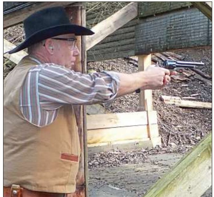
... und dem Western-Revolver.

Prüfen Sie hier, wie Ihre Firma online zu finden ist!