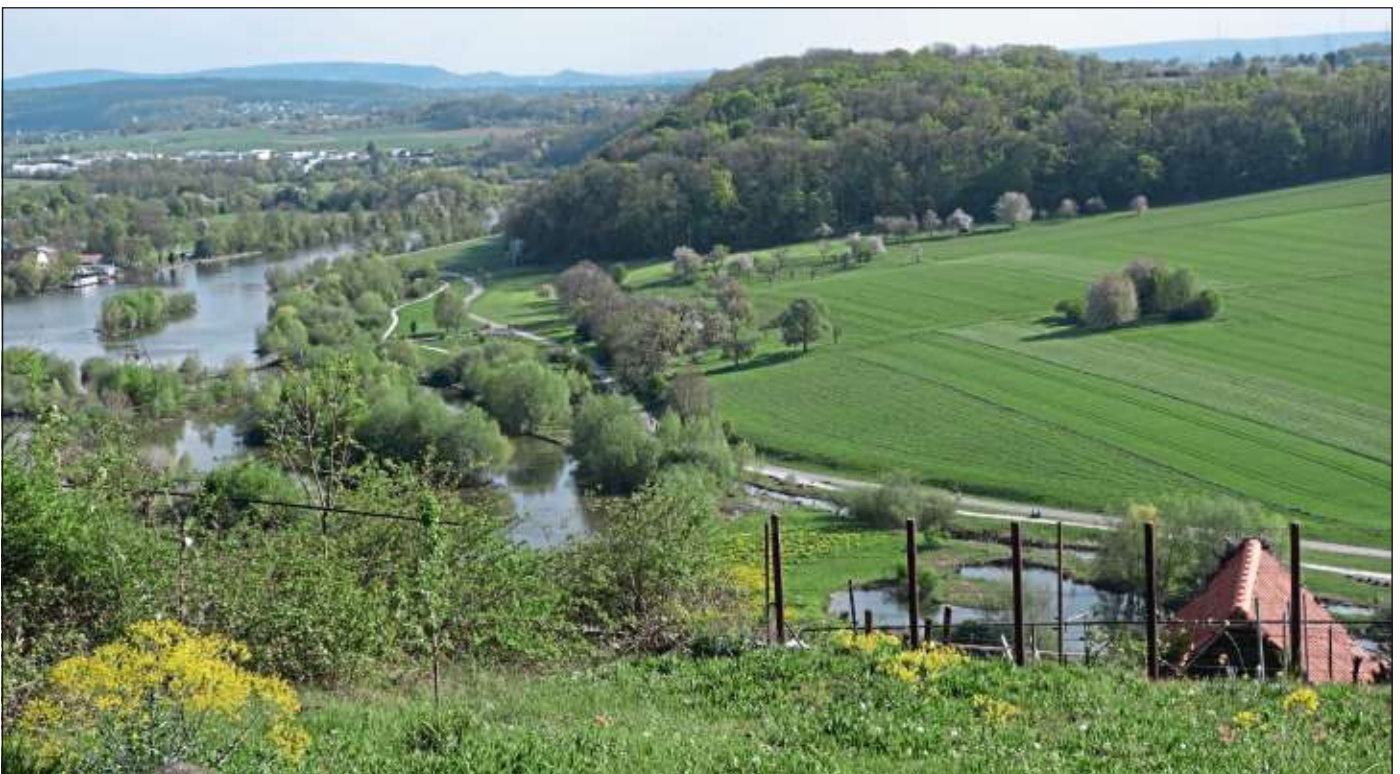
Von dem Höhenweg bieten sich schöne Ausblicke auf den Neckar.

Barrierefreiheit: Die Strecke verläuft auf asphaltierten Straßen. Dennoch müssen mäßig bis starke Steigungen überwunden werden. Am Rande des Grüß-Gott-Weges gibt es zwar Sitzgelegenheiten, die meistens aber nur über Stufen oder unebenen Straßenbelag erreichbar sind.