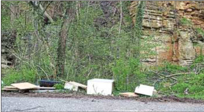
Kein schöner Anblick: illegale Müllentsorgung unterhalb des Bergstirn.